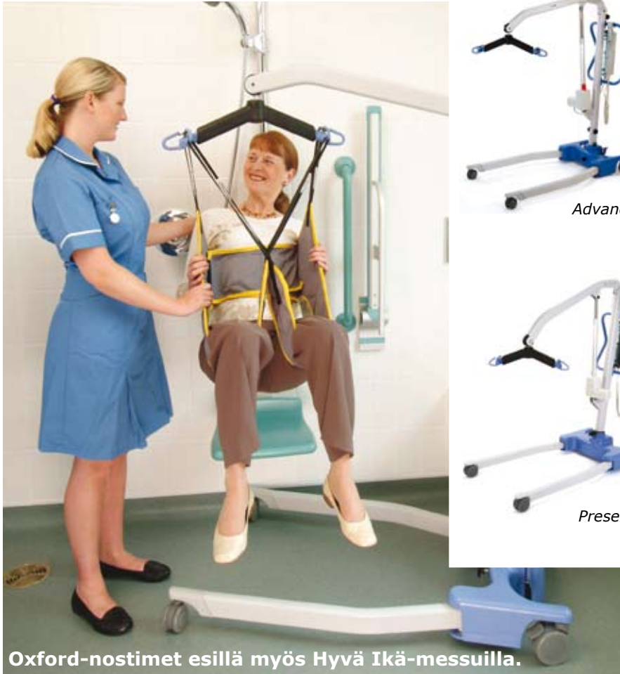
Oxford-nostimet esillä myös Hyvä Ikä-messuilla.